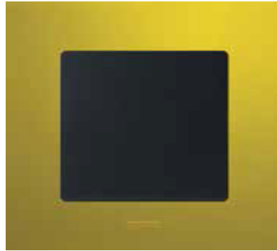
Зелена папороть / Антрацит