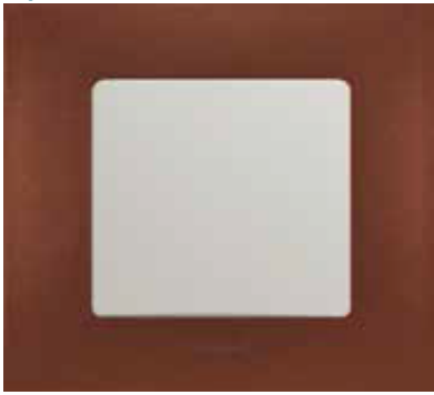
Какао / Слонова кістка