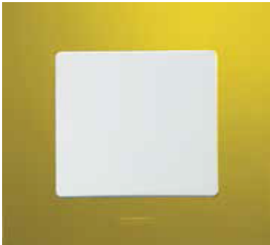
Зелена папороть / Білий