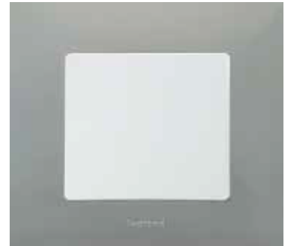
Світла галька / Білий