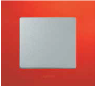
Червоний / Алюміній