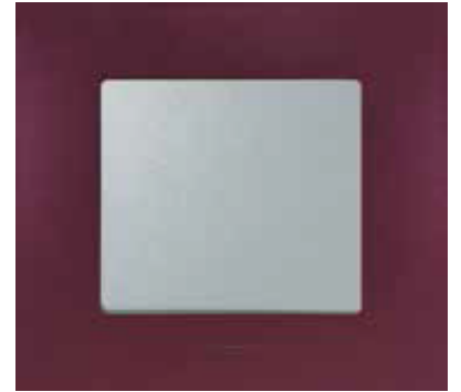
Сливовий / Алюмінієвий